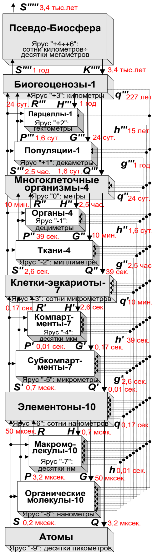
Рис. 1. Схема кибернетической иерархической модели живой природы.